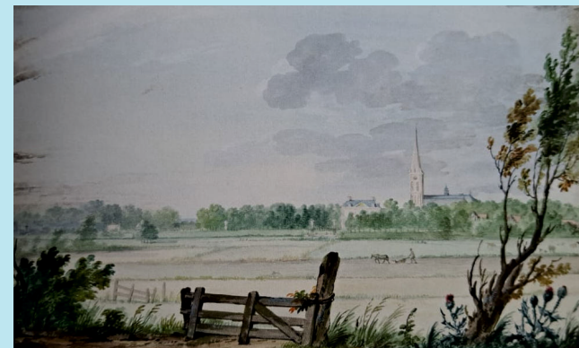
Aquarel van Aert Schouman, 1744. Gebied van deze wandeling.