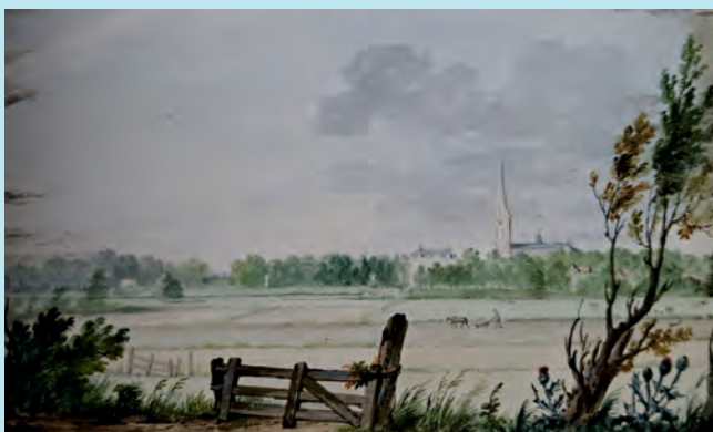
Aquarel van Aert Schouman, 1744. Gebied van deze wandeling.